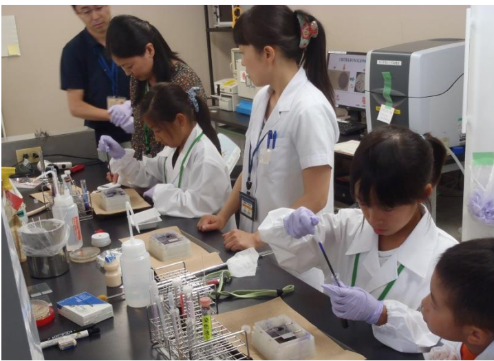
細菌のグラム染色をしてみたよ