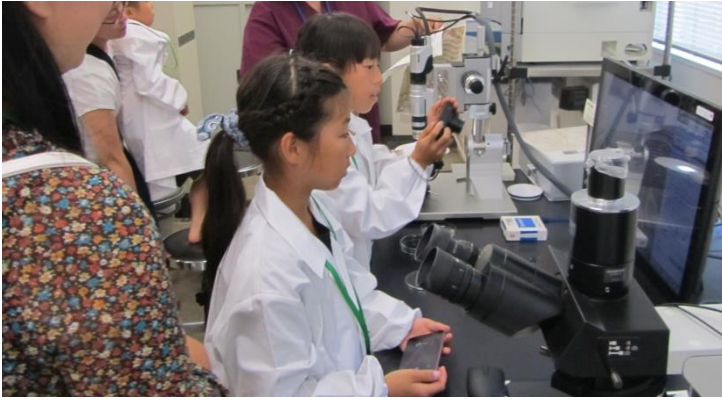
マイクروسコープで拡大して観察したよ