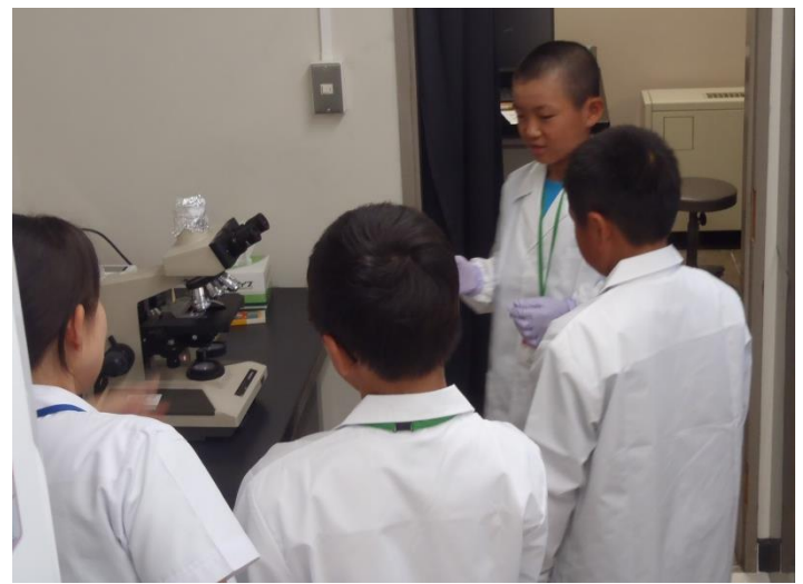
顕微鏡で細菌を観察するよ