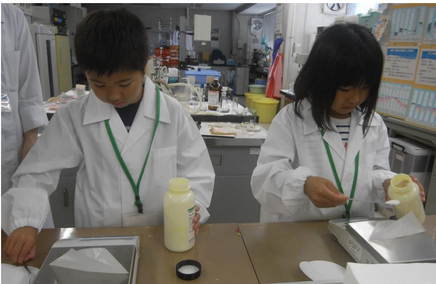
試薬をはかるのは大事な作業、慎重に