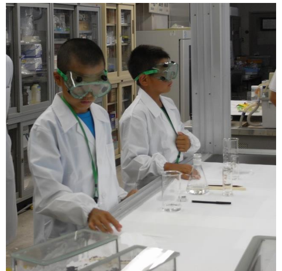
防護用メガネで安全確保

ジュニア研究員のみなさま、お疲れ様でした。今日、楽しいと思えた人なら、きっと科学者（研究員）になれますよ。