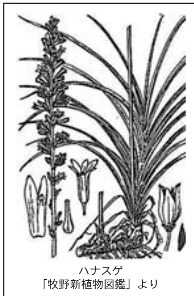
ハナスゲ 「牧野新植物図鑑」より