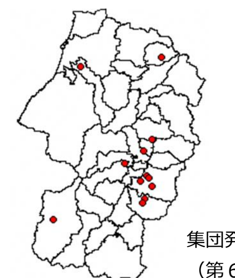
集団発生マップ(第6週)