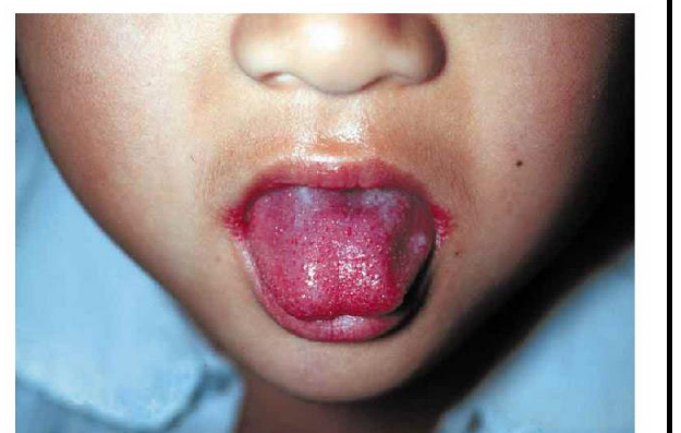
写真1. 典型的な苺舌

A群溶血性レンサ球菌咽頭炎は、患者の咳やくしゃみ等のしぶきに触れることにより感染するため、予防には、手洗いや咳エチケット等の一般的な予防法が大切です。