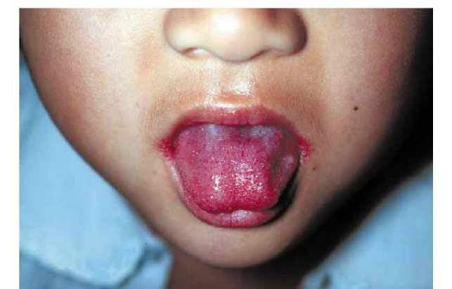
写真1. 典型的な苺舌

A群溶血性レンサ球菌咽頭炎は、患者の咳やくしゃみ等のしぶきに触れることにより感染するため、予防には、手洗いや咳エチケット等の一般的な予防法が大切です。