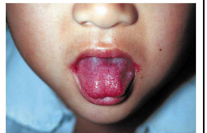
写真1. 典型的な苺舌

A群溶血性レンサ球菌咽頭炎は、患者の咳やくしゃみ等のしぶきに触れることにより感染するため、予防には、手洗いや咳エチケット等の一般的な予防法が大切です。