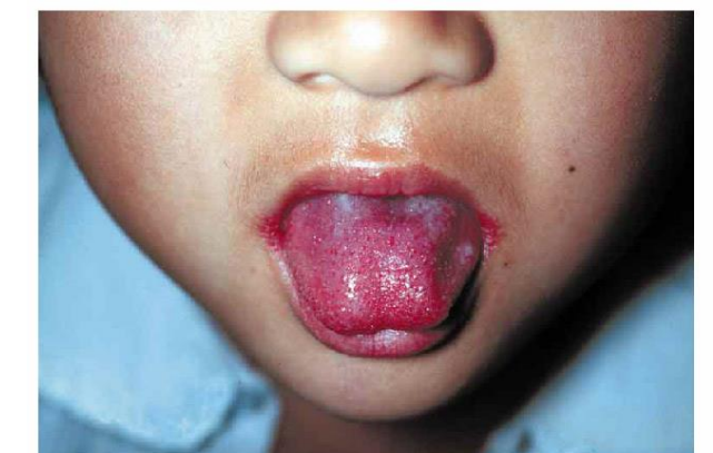
写真1. 典型的な莓舌

2～5日の潜伏期の後、突然の発熱(38℃以上)と、喉の赤みで発症します。喉の腫れ、上あごの点状出血や、舌に赤いプツプツが現れる莓舌(写真1)などの症状がみられることもあります。通常、熱は3～5日以内に下がり、1週間以内に症状は改善します。治療は、抗菌剤が有効です。